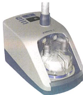
Airvo 2 / myAirvo 2